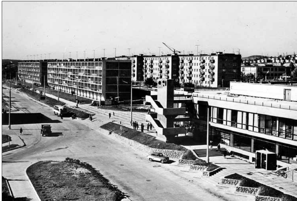
«Енергетик», 1965 рік.