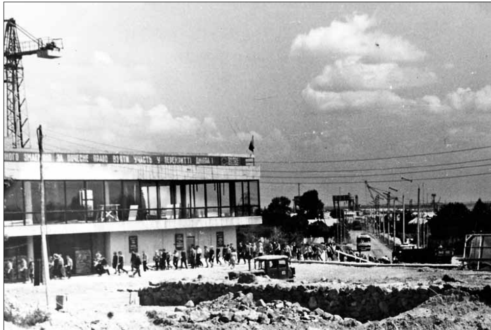
Іде будівництво «Енергетика», 1961-1962 роки.